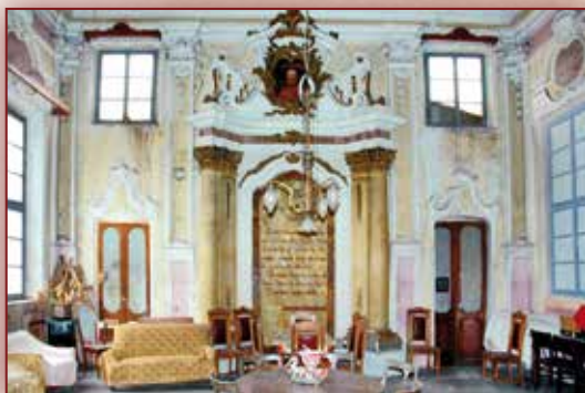
Veduta dell'interno della sinagoga di Rivarolo Mantovano